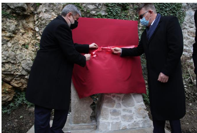
Ceremonija otkrivanja spomenika ųrtvama zemljotresa 1979. godine