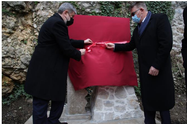
Ceremonia e zbulimit të Përmendores së viktimave të termetit të vitit 1979